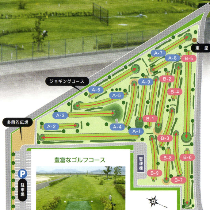
ジョギングコース